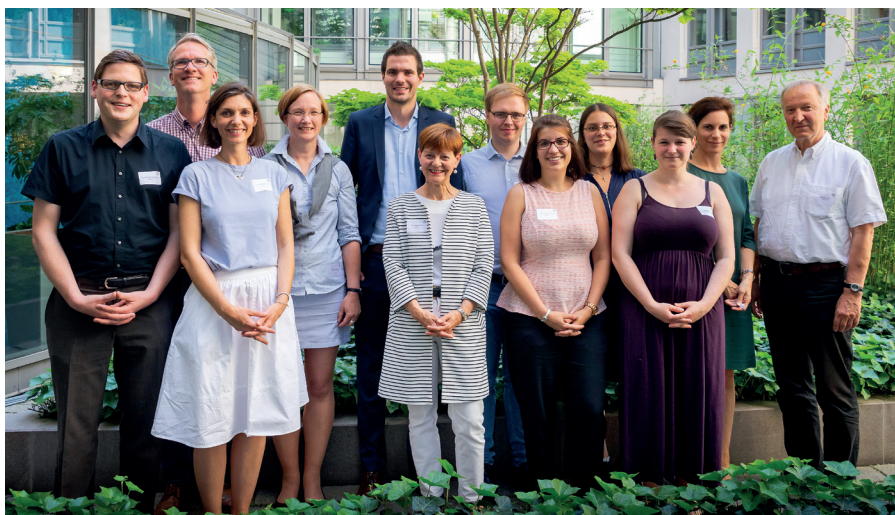
Das Team des b3-Projekts

Bedarfsermittlung findet in verschiedenen Phasen des Rehabilitationsprozesses und sowohl bei Reha-Trägern als auch bei Leistungserbringern statt. Im Einzelnen sind bei der Bedarfsermittlung jedoch unterschiedliche Zielstellungen relevant. Diese ergeben sich aus der institutionellen Rolle des Akteurs sowie dem Zeitpunkt ihrer Durchführung. Im Rahmen des Leistungszugangs und der Leistungsbewilligung (Initiierung von LTA) sind auf Basis von Beeinträchtigungen Teilhabeziele zu entwickeln und möglichst passende Leistungen und Hilfen zur Konkretisierung von Teilhabe zu identifizieren (Leistungsbemessung). Dies ist insbesondere die Aufgabe der Reha-Träger. Für sie sind Ergebnisse der Bedarfsermittlung die Basis